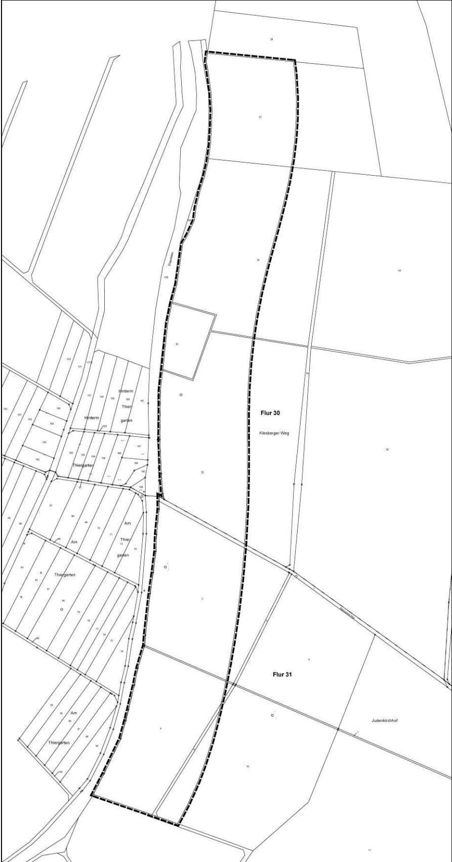
genordet, ohne Maßstab